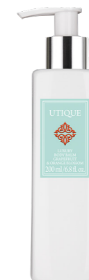
GRAPEFRUIT & ORANGE BLOSSOM

200 ml | 502047 | 29,95 EUR 149,75 EUR / 11