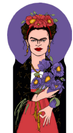
the tweezerless icon