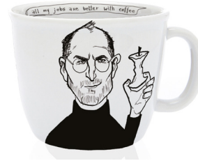
the apple seller STEVE, big cup, 3830062001076