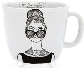
the fair ingenue AUDREY, big cup, 3830062000055