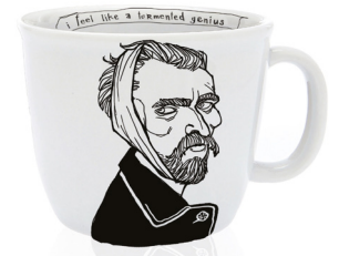
the earless impressionist VINCENT, big cup, 3830062000925