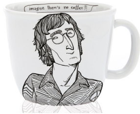
the naked pacifist