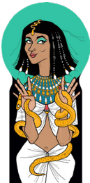
the royal femme fatale