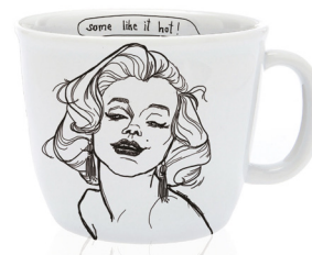
the platinum goddess