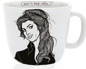
the soulful rockabilly AMY, big cup, 3830062000109

Beaux, mais légèrement sauvages, créatifs mais également fiables, inspirés par les plus grands noms de la culture pop, Les tasses PolonaPolona existent pour insuffler de la magie dans le quotidien.