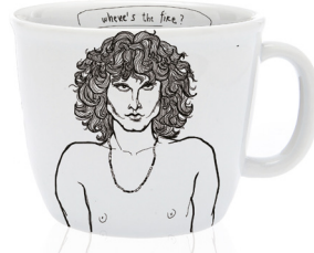
the lizard king JIMI, big cup, 3830062000123