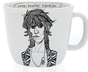
the embodiment of rock'n'roll