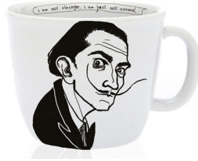
the surrealistic dadaist SALVADOR, big cup, 3830062000796

Une fois par an, nous introduisons un nouveau héros. Récemment nous avons commencé à impliquer un large public de followers dignes de confiance à s'engager dans notre processus de sélection, via les réseaux sociaux.