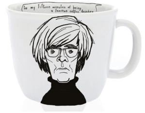
the pop celebrity ANDY, big cup, 3830062000918

Beaux, mais légèrement sauvages, créatifs mais également fiables, inspirés par les plus grands noms de la culture pop, Les tasses PolonaPolona existent pour insuffler de la magie dans le quotidien.