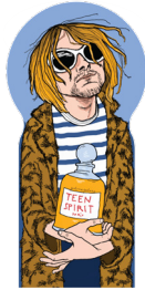
the delicious grunger