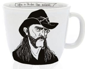
the hoarse-voiced cowboy