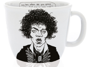
the experienced guitar hero JIMI, big cup, 3830062000291

Elles portent non seulement les plus grandes stars, mais apportent également une touche de style à votre table. Peuvent être une déclaration d'intention, une preuve de goût, ou simplement le meilleur cadeau que vous ayez reçu.