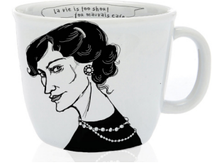
the chicest parisienne COCO, big cup, 3830062000093