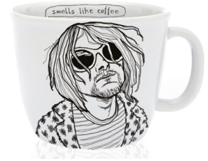
the delicious grunger

Le monde de PolonaPolona est aussi immense et coloré que la culture Pop. Mais au sommet de la liste des best sellers, il reste les seuls grands esprits, cœurs et mains inspirées de notre époque.