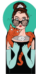
the fair ingenue