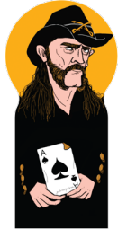
the hoarse-voiced cowboy