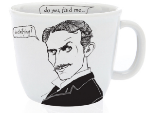
the storm chaser