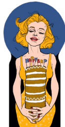
the platinum goddess