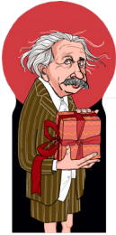
the atomic relativist