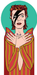
the glam rocker