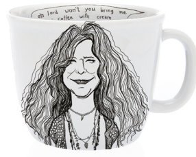
the braless flower child JANIS, big cup, 3830062000130