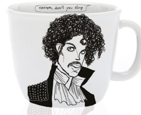
the purple majesty PURPLE, big cup, 3830062000604