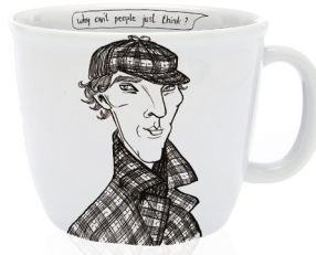
the hunk of bakerstreet SHERLOCK, big cup, 3830062000451