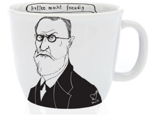
the couch therapist SIGMUND, big cup, 3830062000260

Une fois par an, nous introduisons un nouveau héros. Récemment nous avons commencé à impliquer un large public de followers dignes de confiance à s'engager dans notre processus de sélection, via les réseaux sociaux.