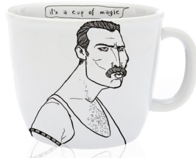
the mercurial champion FREDDIE, big cup, 3830062000598