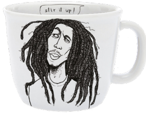
the reggae lion BOB, big cup, 3830062000055