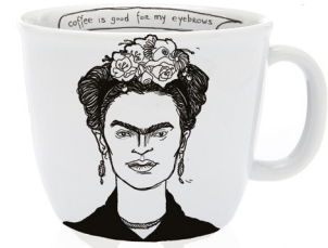
the tweezerless icon FRIDA, big cup, 3830062000222