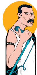
the mercurial champion