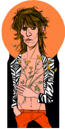
the embodiment of rock'n'roll