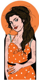
the soulful rockabilly