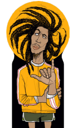
the reggae lion