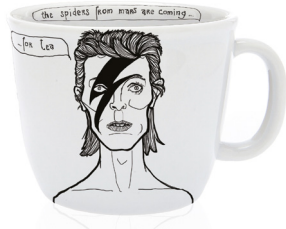
the glam rocker DAVID, big cup, 3830062000093