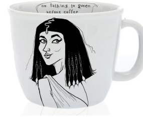
the royal femme fatale CLEOPATRA, big cup, 3830062000093