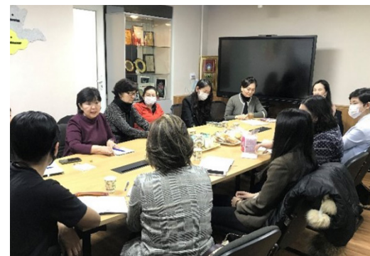
Rencontre trimestrielle des organisations

Avec les organisations partenaires, nous poursuivons la pratique de tenir des réunions trimestrielles, nous avons organisé quatre types de formations identifiées pour et par le personnel des organisations, et renforcé les capacités en organisant plusieurs activités avec leur participation.