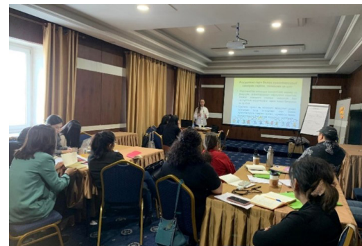
Formation en étude de cas