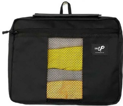
SINGLE LUGGAGE ORGANIZER