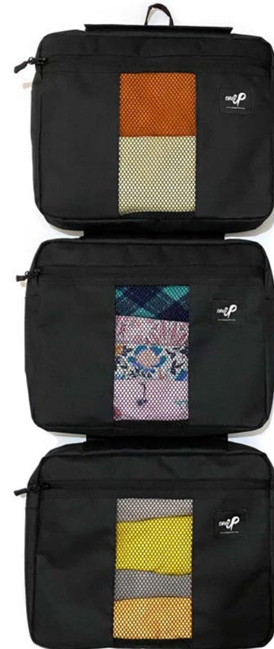
TRIPLE LUGGAGE ORGANIZER