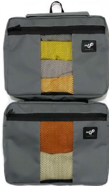
DUAL LUGGAGE ORGANIZER