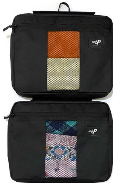
DUAL LUGGAGE ORGANIZER