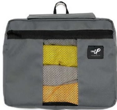
SINGLE LUGGAGE ORGANIZER