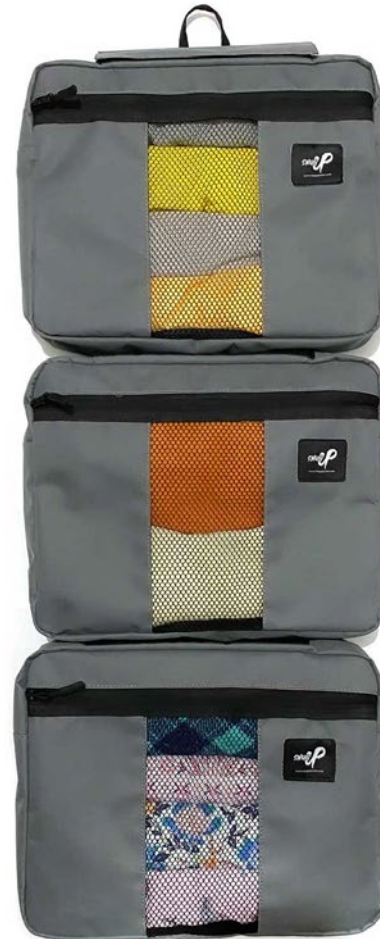
TRIPLE LUGGAGE ORGANIZER