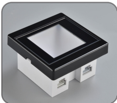
USB-5 Pin Anschluss