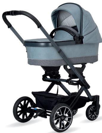
Avantgarde Kinderwagen mit Falttasche Premium (als Zubehör erhältlich)