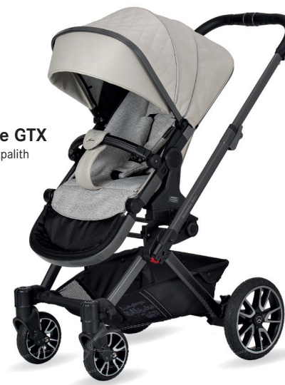
Avantgarde GTX 2382-112-844 opalith