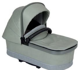
Falttasche Premium 4077-07-847