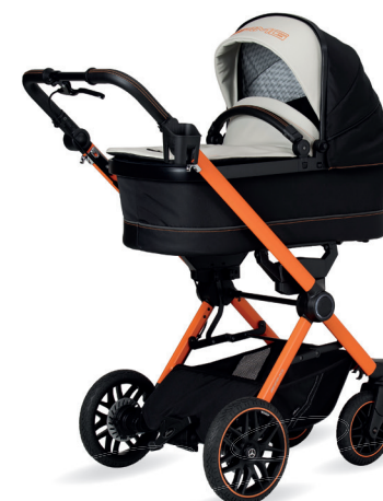
AMG GT 2 Kinderwagen mit Falttasche Premium (als Zubehör erhältlich)