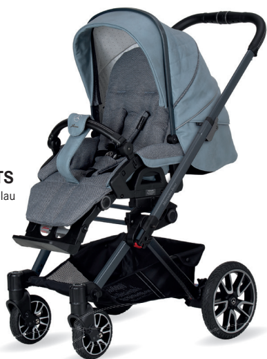
Avantgarde GTS 2381-191-845 denimblau