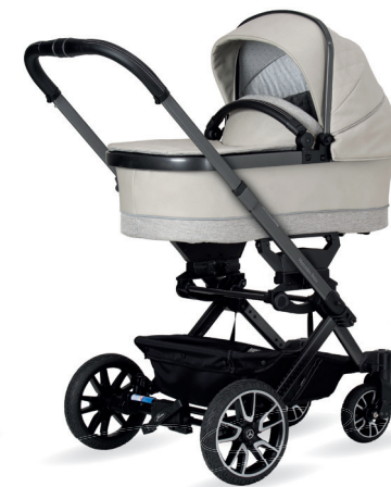
Avantgarde Kinderwagen mit Falttasche Premium (als Zubehör erhältlich)