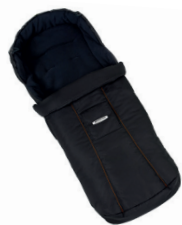
Fußsack AMG GT² 5840-63-851