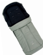
Winterfußsack GTX 5829-63-847