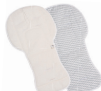
Wendeauflage „cozy“ 5844-00-851