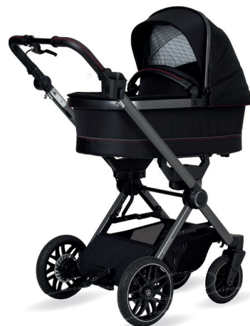
AMG GT 2 Kinderwagen mit Falttasche Premium (als Zubehör erhältlich)