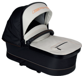
Falttasche Premium 4078-07-851