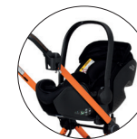
AMG Fahrgestell mit Babyschale (Adapter als Zubehör erhältlich)