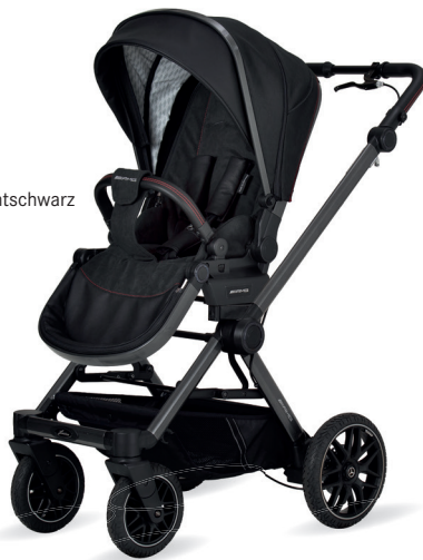
AMG GT 2 2385-193-850 nachtschwarz

Cupholder – einfache Befestigung – Babyflasche immer griffbereit – im Lieferumfang enthalten