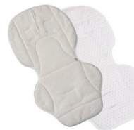
Wendeauflage „cozy“ GTX/GTS 5843-00-847