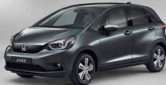
METALICKÁ SHINING GRAY