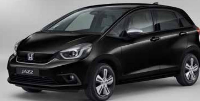
PERLEŤOVÁ CRYSTAL BLACK