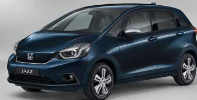
METALICKÁ MIDNIGHT BLUE BEAM