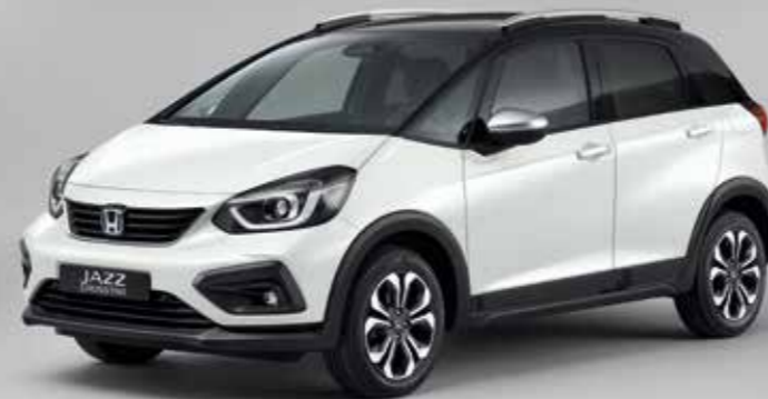
PERLEŤOVÁ PLATINUM WHITE / DVOUTÓNOVÁ VARIANTA