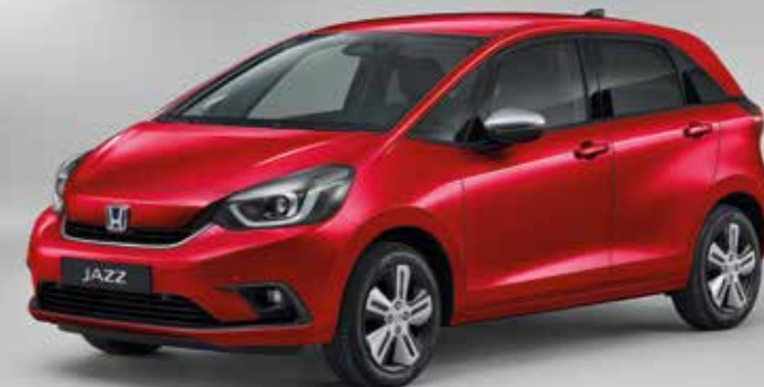
PRÉMIOVÁ METALICKÁ CRYSTAL RED