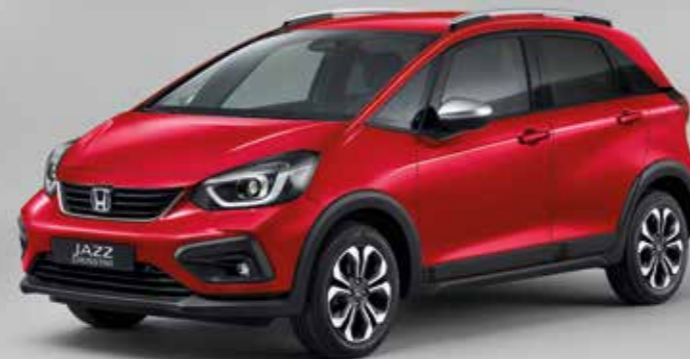
PRÉMIOVÁ METALICKÁ CRYSTAL RED