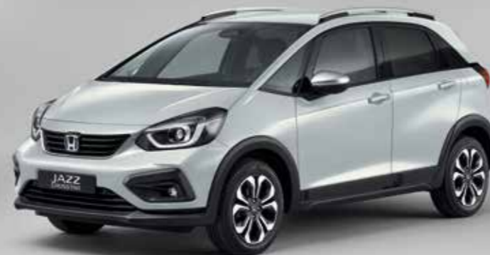
PRÉMIOVÁ PERLEŤOVÁ SUNLIGHT WHITE