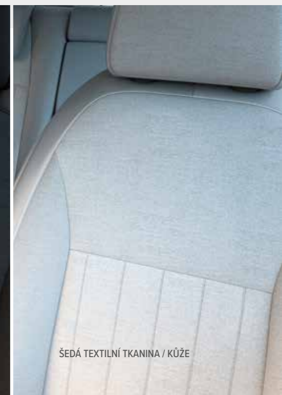
ŠEDÁ TEXTILNÍ TKANINA / KŮŽE