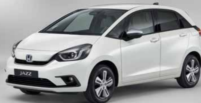
PERLEŤOVÁ PLATINUM WHITE