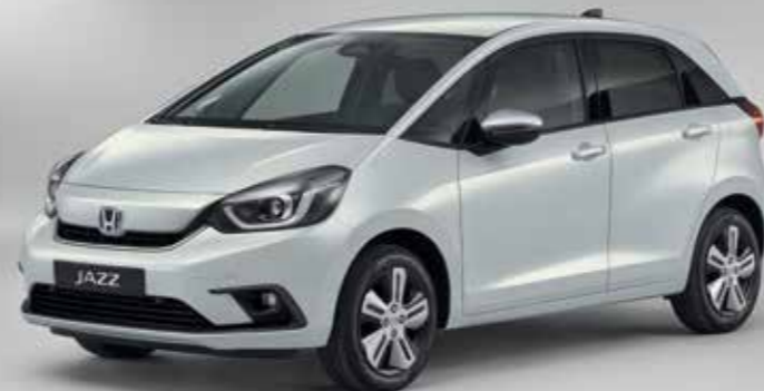
PRÉMIOVÁ PERLEŤOVÁ SUNLIGHT WHITE