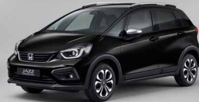
PERLEŤOVÁ CRYSTAL BLACK