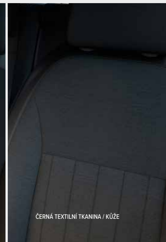
ČERNÁ TEXTILNÍ TKANINA / KŮŽE