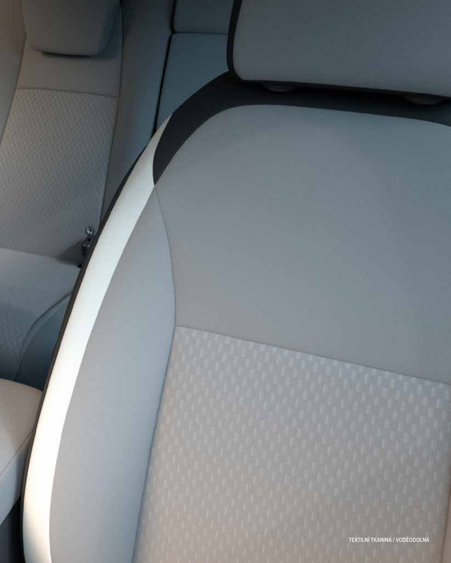
TEXTILNÍ TKANINA / VODĚODOLNÁ