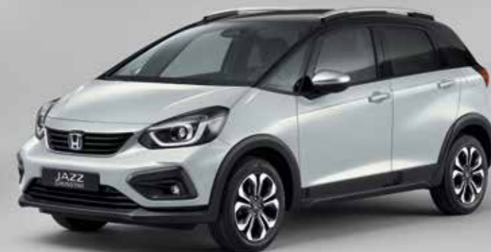
PRÉMIOVÁ PERLEŤOVÁ SUNLIGHT WHITE / DVOUTÓNOVÁ VARIANTA