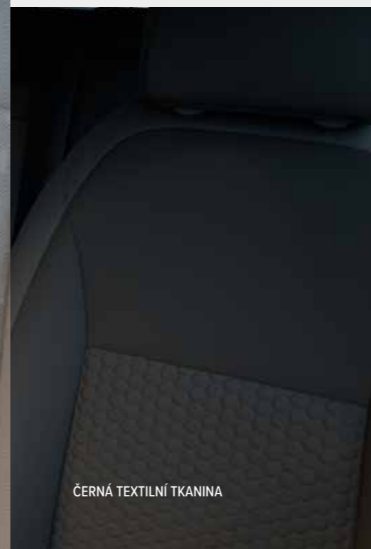
ČERNÁ TEXTILNÍ TKANINA

Barevné kombinace exteriéru a čalounění interiéru se u jednotlivých verzí liší. Více informací vám sdělí dealer společnosti Honda.