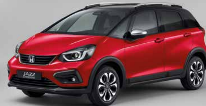
PRÉMIOVÁ METALICKÁ CRYSTAL RED / DVOUTÓNOVÁ VARIANTA