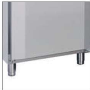
4 pies regulables en altura en dotación.