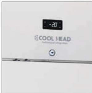
Cerradura de serie.