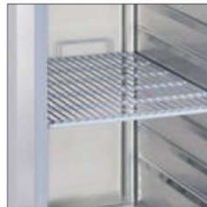
Estantes con tope posterior para facilitar la circulación del aire del armario.