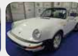
Porsche 911 3.2 WTL 1985