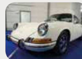
Porsche 911 2.0 T Karmann 1968

+300 voitures de collection à vendre +100 photos / voiture sur www.oldtimerfarm.be