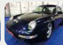
Porsche 911-993 Targa 1996