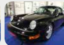
Porsche 911-964 RS America 1993