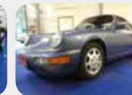
Porsche 911-964 Carrera 4 1990