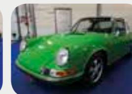
Porsche 911 2.4 T Targa 1972