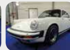
Porsche 911 3.2 Carrera 1986