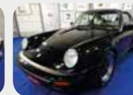
Porsche 911-930 3.3 Turbo G50 1988