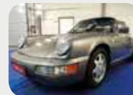
Porsche 911-964 Carrera 2 Targa 1990