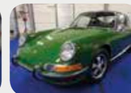
Porsche 911 2.2 E 1970