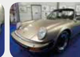
Porsche 911 3.2 Carrera 1984