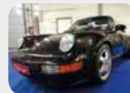
Porsche 911-964 WTL 1993