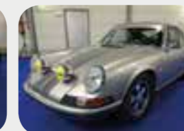
Porsche 911 2.4 T 1973