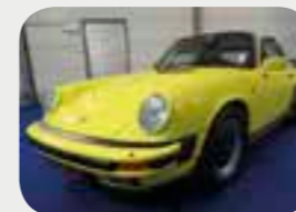
Porsche 911 3.2 Carrera Targa 1985