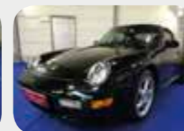
Porsche 911-993 Carrera 4S 1997