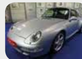
Porsche 911-993 Turbo 1996