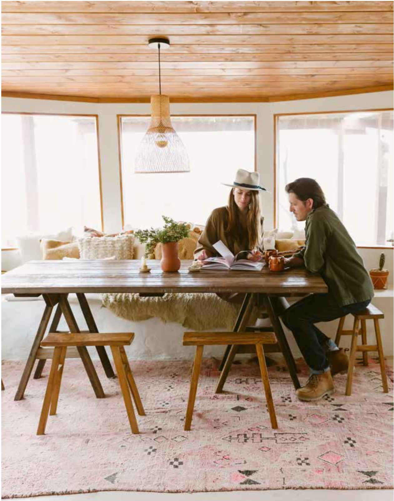
Avec sa banquette en chaux, son tapis folk, ses tabourets artisanaux et sa table fabriquée à partir de bois trouvé dans la maison, la salle à manger est une représentation on ne peut plus moderne de l'esprit bohème qui habite les lieux.