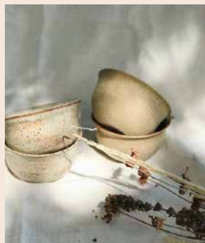
Easy to Breathe