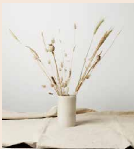
Studio San Paris