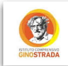
IC Gino Strada