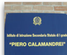
Istituto Piero Calamandrei