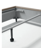
SUPPORTO RETI SINGOLE