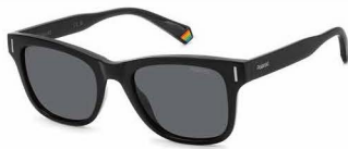
807(M9) ¥10,000 (税込 ¥11,000)