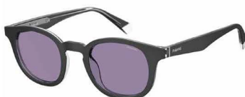
HK8(KL) ¥15,000 (税込 ¥16,500)