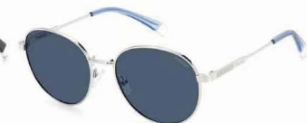
O10(C3) ¥12,000 (税込 ¥13,200)