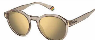
10A(LM) ¥11,000 (税込 ¥12,100)