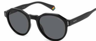
807(M9) ¥10,000 (税込 ¥11,000)