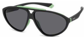
30L(M9) ¥11,000 (税込 ¥12,100)