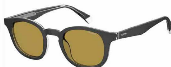
OTL(MU) ¥15,000 (税込 ¥16,500)