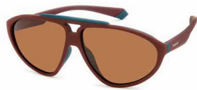
7BL(HE) ¥11,000 (税込 ¥12,100)