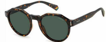
O86(UC) ¥10,000 (税込 ¥11,000)