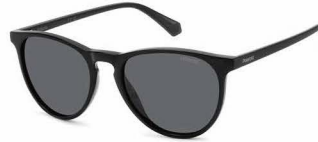
807(M9) ¥10,000 (税込 ¥11,000)