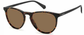
O86(SP) ¥10,000 (税込 ¥11,000)