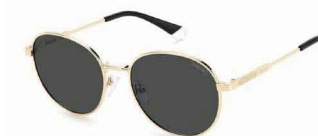
2F7(M9) ¥12,000 (税込 ¥13,200)