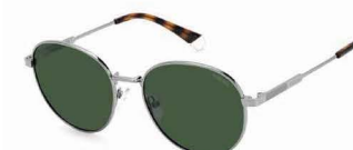
6LB(UC) ¥12,000 (税込 ¥13,200)