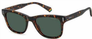
O86(UC) ¥10,000 (税込 ¥11,000)