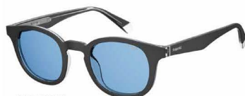
OY4(C3) ¥15,000 (税込 ¥16,500)