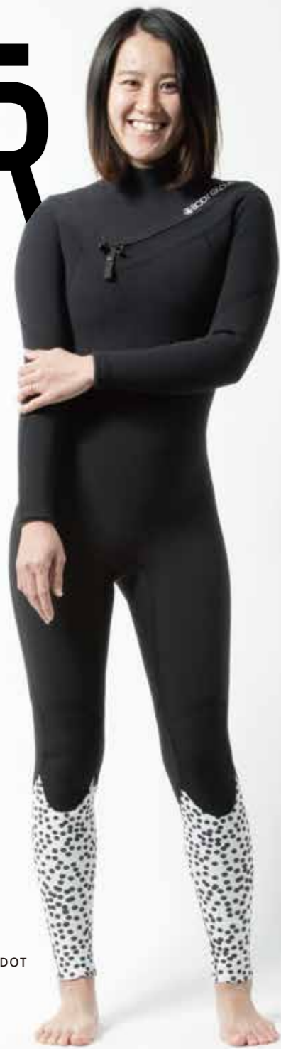
Pro Surfer : Rika Ichikawa