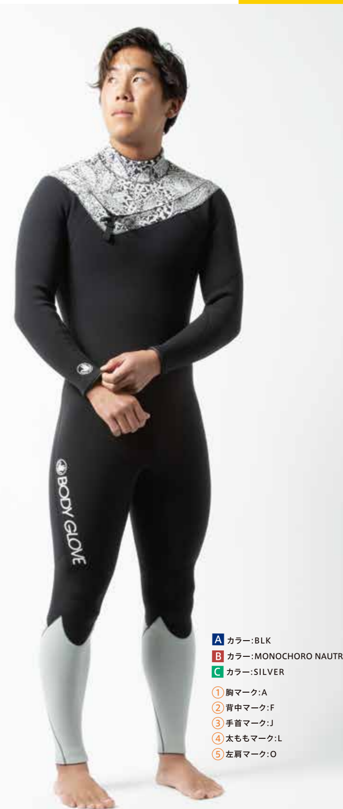
Pro Surfer : Yuji Mishi

※ B C カラーは02ページの「COLOR CHART」内からお選びください。 ※ ロゴマークプリントは02ページの「MARK CHART」内からお選びください。