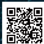
U.S.A. OFFICIAL INSTAGRAM

カタログに掲載された製品は、Body Glove IP Holdings LP社からの ライセンス許諾の元、企画生産したものです。