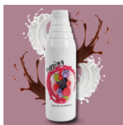
FRUTTI DI BOSCO