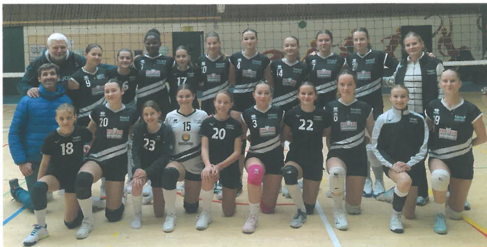
Les deux équipes M13 et M18 victorieuses en coupe de France.

L'équipe départementale, nouvellement créée en début de saison, accumule les victoires en ce début de championnat. L'équipe évolue en championnat régional et est en tête de sa poule avec 4 victoires. L'équipe en Nationale 3 alterne entre défaites et victoires et se classe à la 8 e place de sa poule.