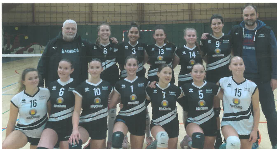
Équipe évoluant en Nationale 3 après sa victoire contre Boufféré VB