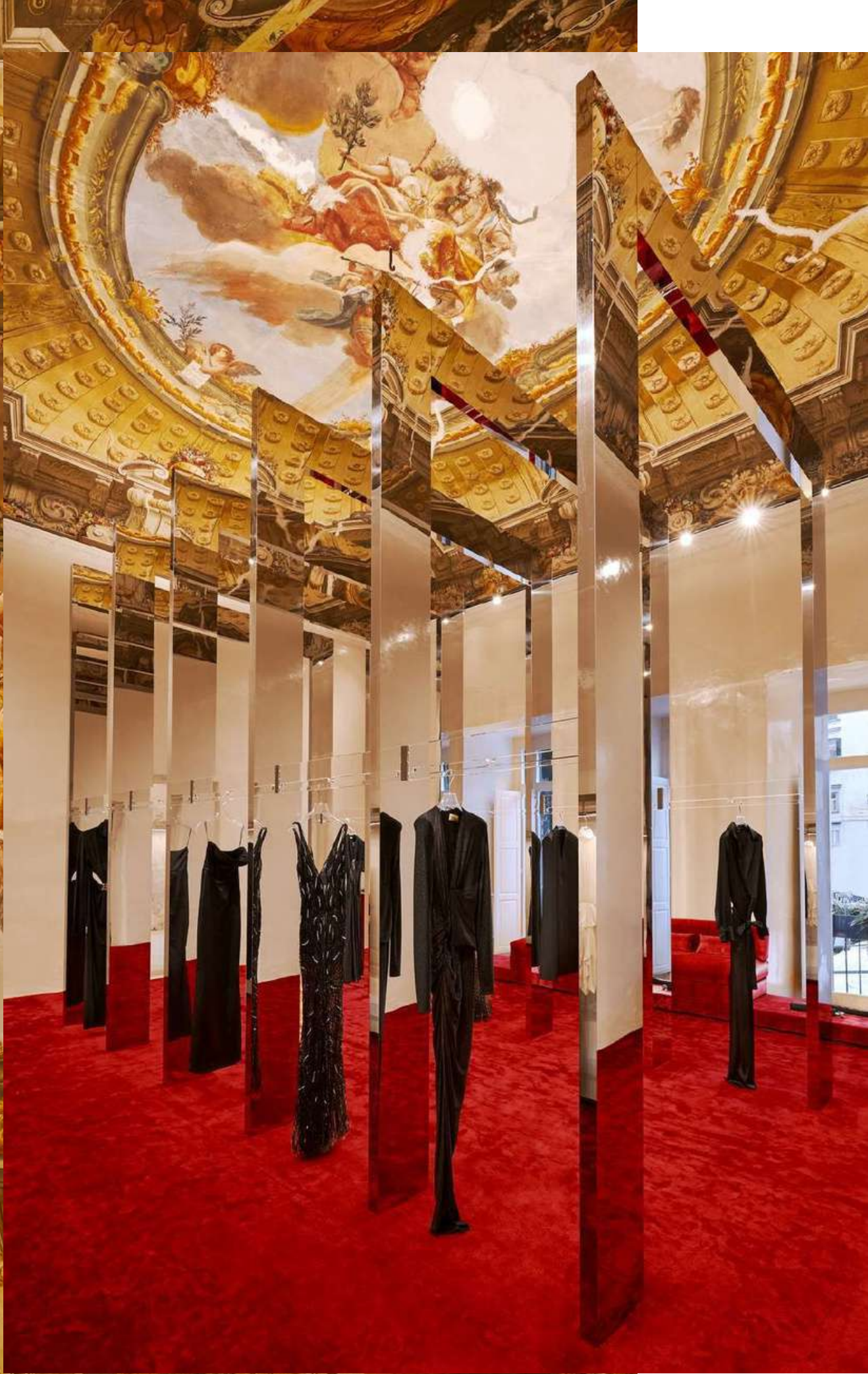
Historical building: Fresco of the 1700s fully restored preserving its historicity and the artistic value.