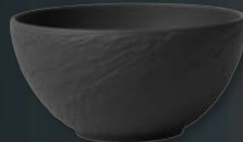
OCR-Nr. 16-4074-1900 0,60 l · 20 ¼ ozs. Bowl · Bol · Schälchen · Tazón · Scodella