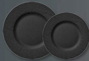
OCR-Nr. 16-4074-2620 270 mm · 10 ½ in. OCR-Nr. 16-4074-2640 220 mm · 8 ½ in. Flat plate · Assiette plate · Teller flach Plato llano · Piatto piano