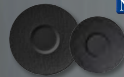
OCR-Nr. 16-4074-1220 170 mm · 6 ¾ in. OCR-Nr. 16-4074-1430 120 mm · 4 ¾ in. Saucer · Soucoupe · Untere Plato taza · Piattino