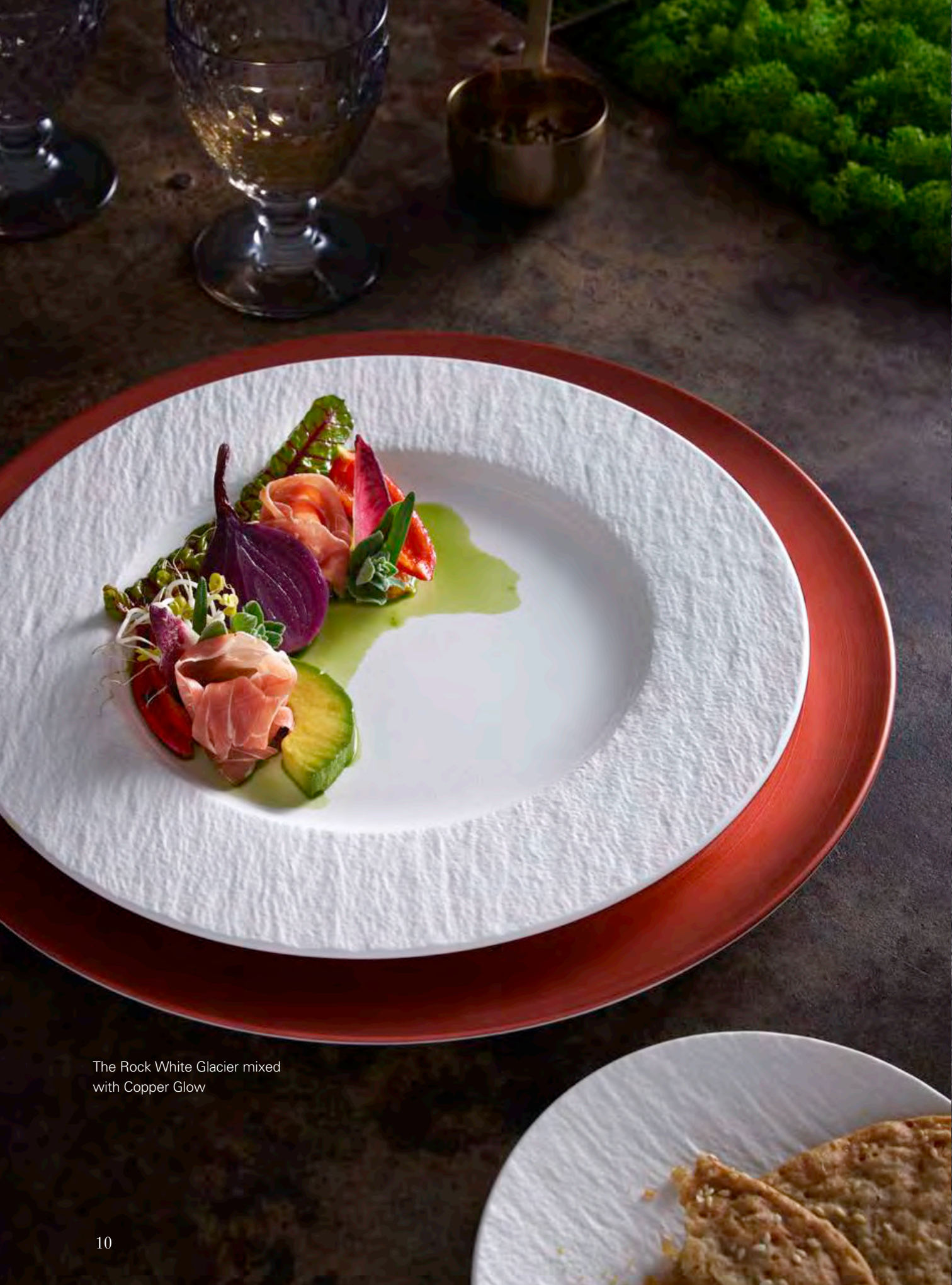
The Rock White Glacier mixed with Copper Glow