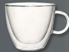
OCR-Nr. 11-7243-8086 95 mm · 0,42 l · 3 ¾ in. · 14 ¾ ozs. Cup set 2pcs · Tasse set 2pcs Tasse Set 2tlg · Tazza set 2pz Taza set 2pzs