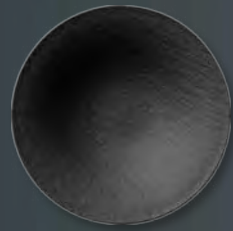
OCR-Nr. 16-4074-2701 Ø 290 mm · 11 ¼ in. Coupe deep plate · Assiette coupe creuse Coupeteller tief · Plato copa hondo Piatto coupe fondo