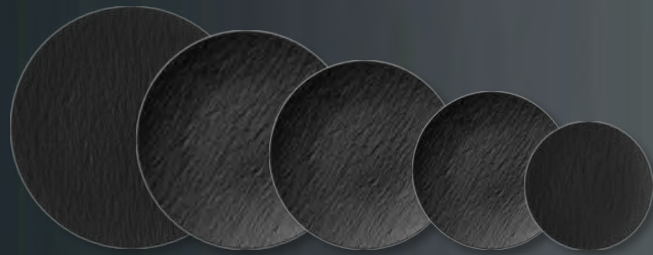
OCR-Nr. 16-4074-2595 Ø 320 mm · 12 ½ in. Coupe flat plate · Assiette plate coupe Coupeteller flach · Plato llano coupe Piatto piano coupe