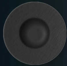
OCR-Nr. 16-4074-2700 Ø 290 mm · 11 ¼ in. Ø 140 mm · 5 ½ in. Deep plate · Assiette creuse · Teller tief Plato hondo · Piatto fondo