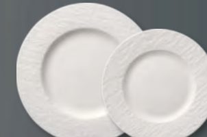
OCR-Nr. 16-4077-2620 270 mm · 10 ½ in. OCR-Nr. 16-4077-2640 220 mm · 8 ½ in. Flat plate · Assiette plate · Teller flach Plato llano · Piatto piano