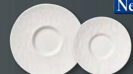
OCR-Nr. 16-4077-1220 170 mm · 6 ¾ in. OCR-Nr. 16-4077-1430 120 mm · 4 ¾ in. Saucer · Soucoupe · Untere Plato taza · Piattino