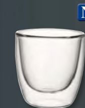
OCR-Nr. 11-7243-8096 95 mm · 0,42 l · 3 ¾ in. · 14 ¾ ozs. Tumbler set 2pcs · Gobelet set 2pcs Becher Set 2tlg · Bicchieri set 2pz Vaso set 2pzs