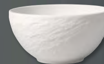
OCR-Nr. 16-4077-1900 0,60 l · 20 ¼ ozs. Bowl · Bol · Schälchen · Tazón · Scodella