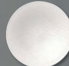
OCR-Nr. 16-4077-2701 Ø 290 mm · 11 ¼ in. Coupe deep plate · Assiette coupe creuse Coupeteller tief · Plato copa hondo Piatto coupe fondo