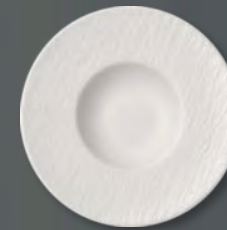
OCR-Nr. 16-4077-2700 Ø 290 mm · 11 ¼ in. Ø 140 mm · 5 ½ in. Deep plate · Assiette creuse · Teller tief Plato hondo · Piatto fondo