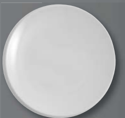
OCR-Nr. 10-4264-2601 Ø 290 mm, H = 24 mm Ø 11 ¼ in., H = 1 in. Flat plate · Assiette plate Speiseteller · Plato llano Piatto piano