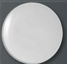
OCR-Nr. 10-4264-2620 Ø 270 mm, H = 24 mm Ø 10 ⅔ in., H = 1 in. Flat plate · Assiette plate Speiseteller · Plato llano Piatto piano