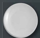
OCR-Nr. 10-4264-2660 Ø 160 mm, H = 19 mm Ø 6 ¼ in., H = ¾ in. Bread & Butter Plate · Assiette à pain Brotteller · Plato fruta / queso / pan Piatto pane