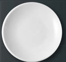
OCR-Nr. 10-4264-2701 Ø 250 mm, H = 40 mm · 0,90 l Ø 10 in., H = 1½ in. · 30½ ozs. Bowl flat · Coupe plate · Schale flach Fuente llana · Coppa piana