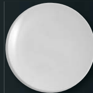
OCR-Nr. 10-4264-2640 Ø 240 mm, H = 21 mm 9 ½ in., H = 1 in. Salad plate · Assiette dessert Frühstücksteller · Plato postre Piatto dessert