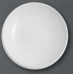
OCR-Nr. 10-4264-2700 Ø 290 mm, H = 48 mm · 1,70 l Ø 11 ½ in., H = 2 in. · 57½ ozs. Deep bowl · Coupe creuse · Schale tief Fuente honda · Ciotola fonda