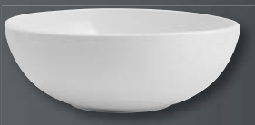
OCR-Nr. 10-4264-3160 Ø 285 mm, H = 103 mm · 4 l Ø 11 ¼ in., H = 4 in. · 135 ¼ ozs. Salad bowl L · Saladier L Schüssel rund L Ensaladera redonda L Insalatiera L