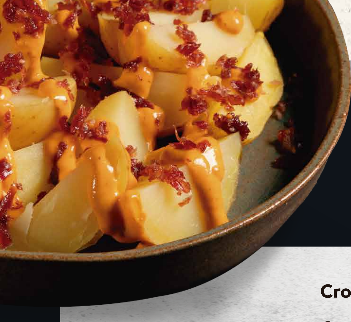
PATATAS BRAVAS IBÉRICAS