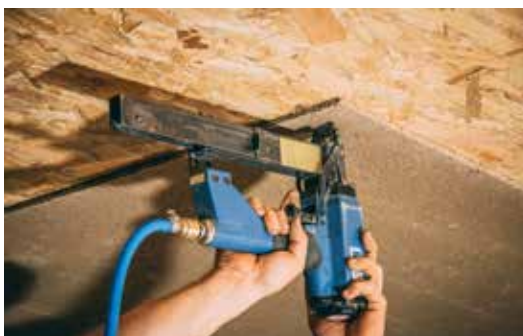
Problemloses anbringen mit Tacker

klimateutrales Bauen durch CO 2 -Speicherung