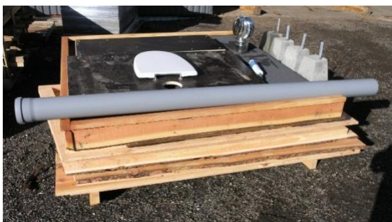
Komplet samlesæt i 6 dele, alle nødvendige materialer medleveres.