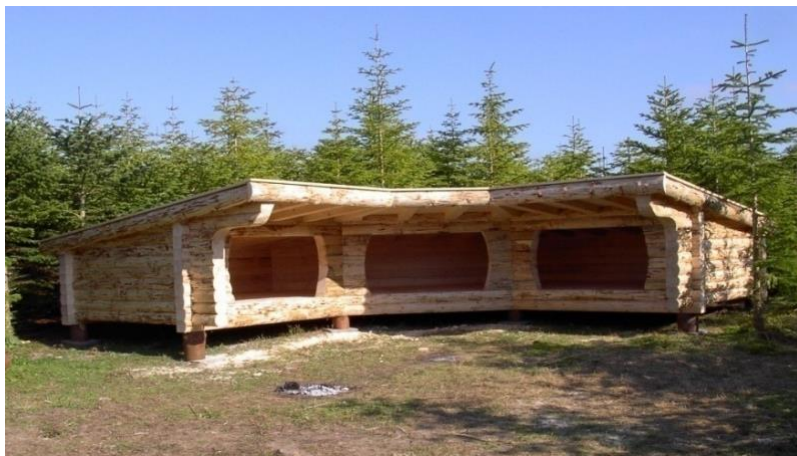
Nr Alslev, Falster.