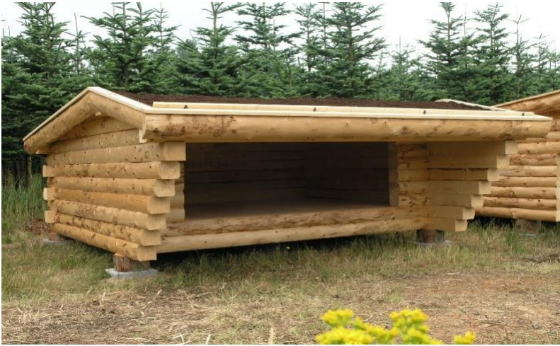
Shelter på 2,5 x 3,5 meter indvendig gulvmål. Vælg mellem saddeltag som foto, eller med ret tag.