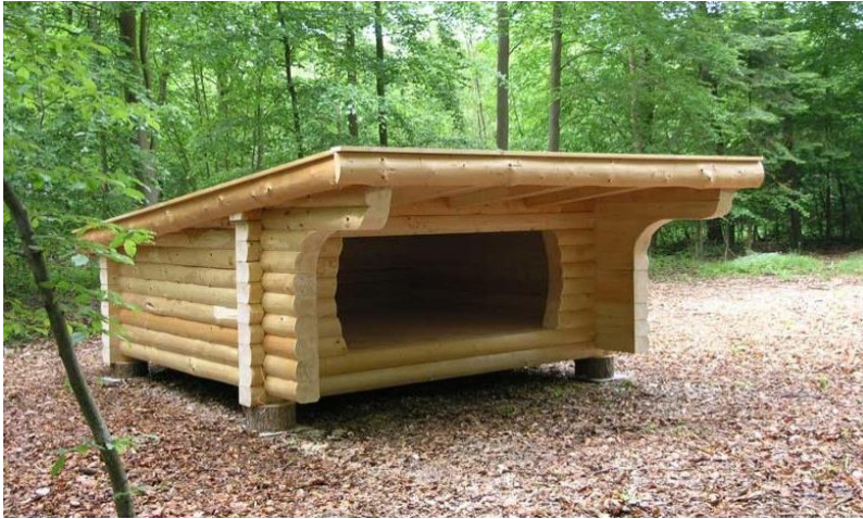
Shelter på 2,5 x 3,0 meter indvendig gulvmål, Rødby, Lolland