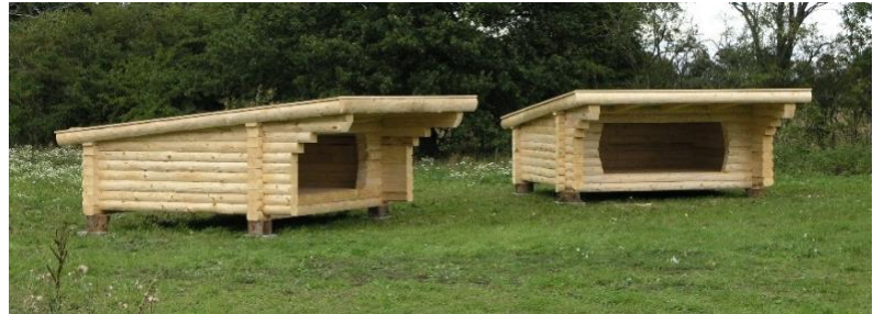
Shelters på 2,5 x 3,0 meter indvendig gulvmål. Vælg mellem ret tag som foto eller saddeltag.

"Flagskibet" og den mest populære model i serien af sheltere, er fuldtømmer shelteren, bygget af stammer skåret på tre sider og med den naturlige runding udad.