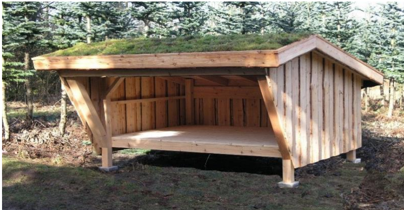
Shelter med græstag

Her er shelteren for dig der kan og vil selv, og samtidig vil opnå tilfredsstillelsen ved eget veludført arbejde.