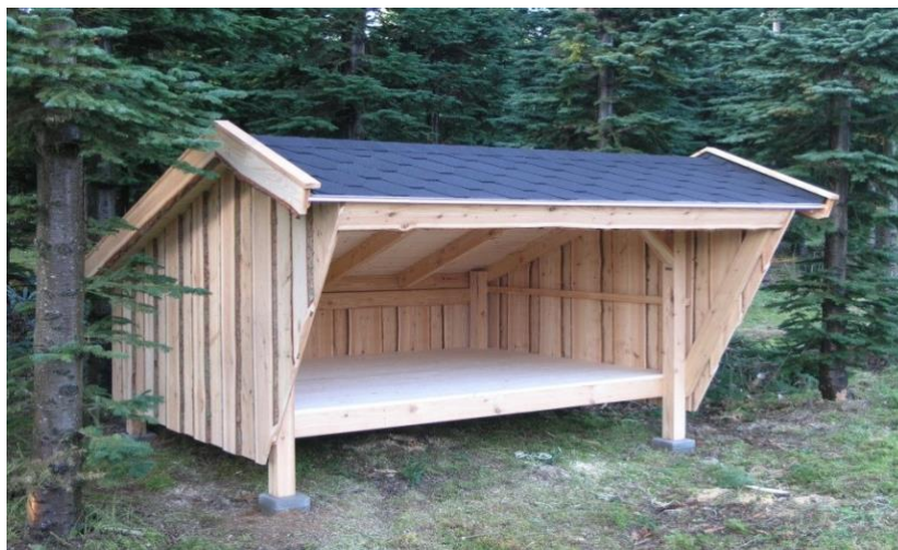
Tag med tagpap shingels

Vaterpas, hammer, skruemaskine med bits torx 20 og 30, vinkel, tommestok, blyant, målebånd 5 m, fugepistol, stanley-kniv, nedstryger eller blyksaks til afkortning af fodblik, håndsav og gerne en rundsav eller dyksav (ej vist på foto). Høvl til affasning af kanter efter smag og behag.