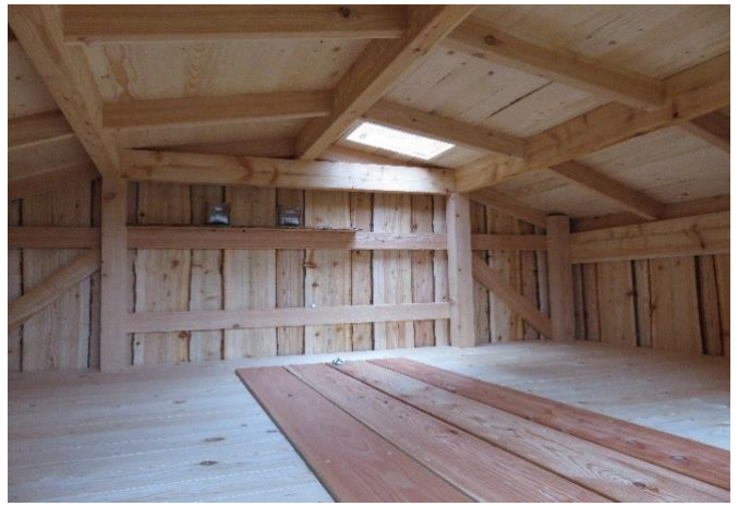
Også mulighed for ovenlys (tilkøb)