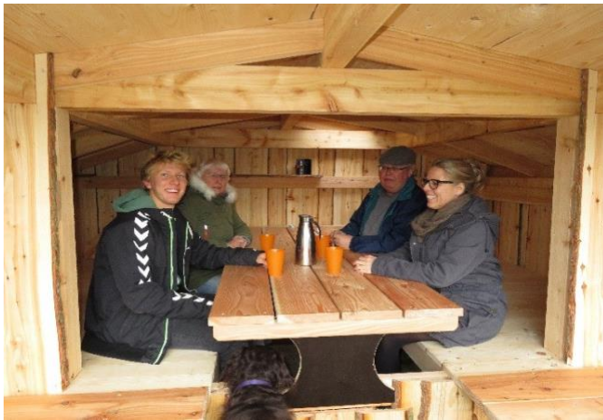
Indbygget bord er tilkøb

Vi tilbyder også denne shelter, enten som byggesæt eller færdig opstillet. Byggesættet, der er for dig der gerne kan og vil selv (og har "værktøjet i orden"), indeholder alle de materialer der medgår til byggeriet. I byggesættet leveres alt træ i uafkortede rålængder.