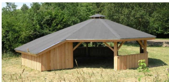
FDF Spejderne, Thyrted-Uth, Horsens. Bålhytte 7 x 7 meter, med tilbygning på 2 x 3 meter til scene.

Træ, der ikke er i kontakt med jord, samt stort tagudhæng, sikrer meget lang levetid.