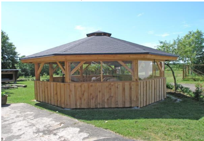
Bålhytte med tagpap shingels samt vinduer