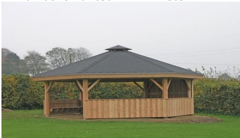
Hjerndrup v/ Christiansfeldt