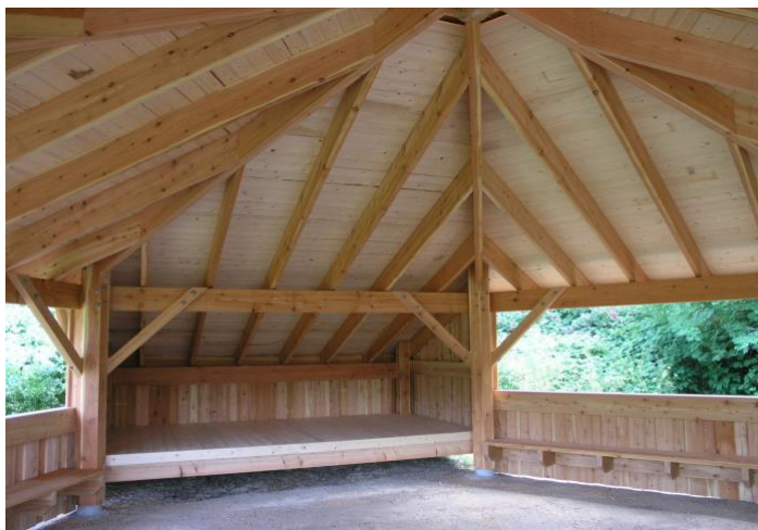
Påbygget shelter, Ebeltoft.

Denne bålhytte giver forholdsvis meget vægplads og dermed mulighed for mange siddepladser med fastmonterede bænke på væggene og god pladsudnyttelse med bålsted i midten.