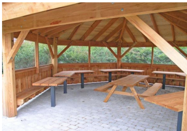
Fastmonterede bænke langs siderne er standard, fastmonterede borde er ekstra.

Denne bålhytte giver forholdsvis meget væglads og dermed mulighed for mange siddepladser med fastmonterede bænke på væggene og god pladsudnyttelse med bålsted i midten.