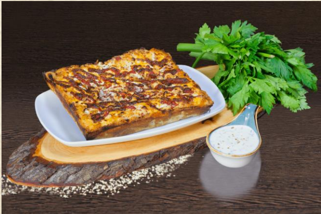
Buffalo Ranch Chicken Deluxe Pizza