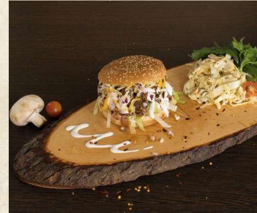
Pulled Beef Burger

Viele Produkte auch sind vegetarisch möglich