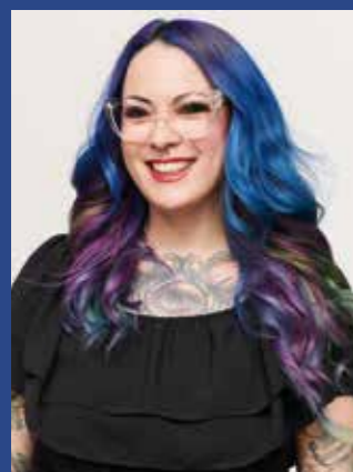
@miss_sita_Zoroa Indola-ambassadør i Spania, #IndolaSelected medlem, salongeier i Barcelona, Indola fargeekspert

“ Jeg valgte å bli en uvanlig type frisør; ekstremendringer har alltid vært en inspirasjon og gåte for meg... det er som å være en magiker. Med min mange års erfaring lærte jeg at du må ha absolutt tillit og kontroll over produktet du jobber med. Den samme tilliten og garantien er det jeg overfører til kundene mine, og det er grunnen til at alt galskap kan skje i salongen min. Det er en kjede... Setningen "gjør hva du vil" er veldig populær hos nesten alle mine kunder. Til slutt kan du gjøre en morsom behandling takket være kreativiteten til koloristen, støttet av selvtilliten og motivasjon fra kundene.