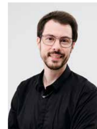
@gilles_indola Erfaren lærer, Indola fargeekspert

“ Det jeg elsker med Ode To Color er det faktum at den takler ulike aldersgrupper og kulturer. kolleksjonen gjenspeiler mine kunders ønsker i mitt daglige virke. Alt fra hvitdekning, til bleking og balayage, eller til og med grå utsmykning og pasteller, dette er alt hva kundene spør om. Helt konkret kan kolleksjonen tilpasses den mannlige målgruppe ved å bruke Indola XPRESSCOLOR – en serie som lar deg oppnå en perfekt grå blanding på kun 10 minutter! Slike produkter som NN2 eller CC2 er et must-have for fargeelskere. Til slutt, det jeg kan anbefale kundene for å bevare looken de har fått i salongen er å bruke tilpassede produkter som en fargesjampo og kur eller balsam. De låser fargepigmenter i de indre hårfiberne for å forhindre at fargen falmer. En annen mulighet ville være å bruke et produkt som COLOR STYLE MOUSSE til en rask og enkel fargeforfriskning eller nøytralisering. ”