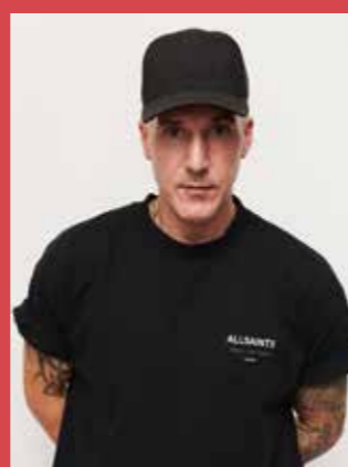
@andysmith_stylist Global klipp & styling ambassadør, kreativ direktør med base i London

“ For meg, som stylist, er farge så viktig for å fullføre det endelige resultatet - kommunikasjonen mellom koloristen og meg må være grundig. Jeg føler virkelig at en farge kan vise frem skjønnheten til en form eller struktur i en hårklipp, men kan også hindre den hvis de ikke er riktig smeltet sammen. Noen ganger må du la en av dem være foran og la den andre sitte i bakgrunnen for å opprettholde kvalitet og en luksuriøs cool finish. Plasseringen av fargen legger også til et vakkert fokuspunkt og skaper dybde med stilen. Ved å kombinere de to sammen på riktig måte kan du skape et flott vakkert hår... ”