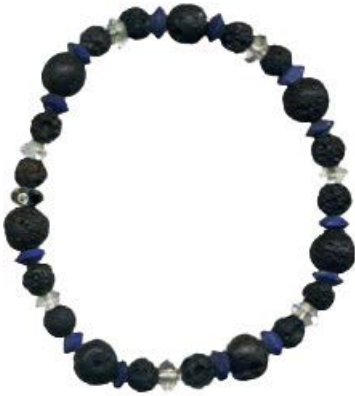
lapis, quarts, lava & silver