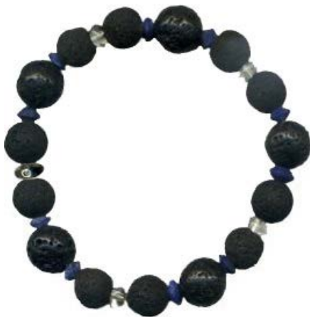
lapis, quarts, lava & silver