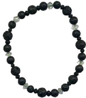
10AD-108sp quartz volcano suutra* (small)