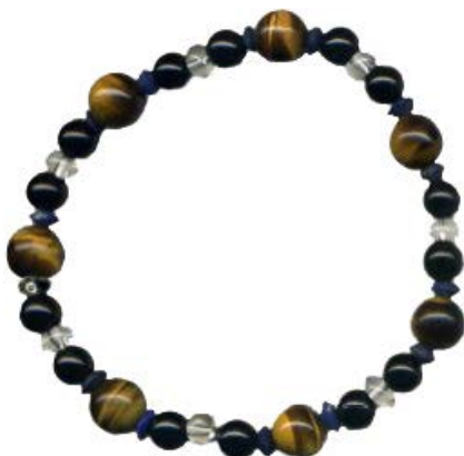
lapis, quarts, onyx, tiger eye & silver