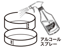
アルコールスプレー