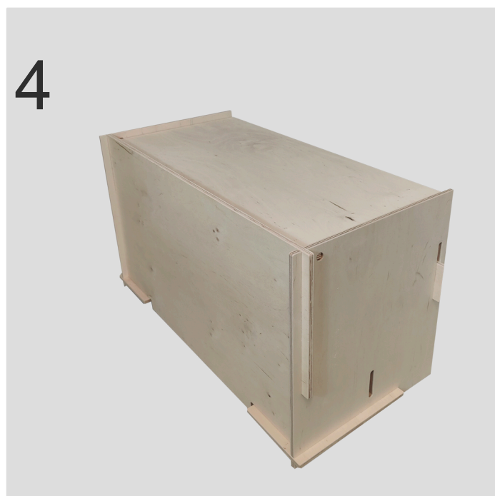
4 Ryggen (f) glides, som låser alle delene sammen.