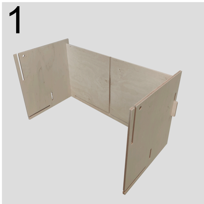
1 Front (d) klikkes på siderne (a)