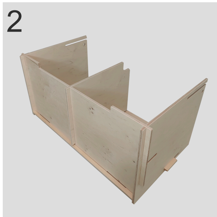
2 Placer Claus med fronten ned, og indsæt først bund (c) og derefter midte (b).