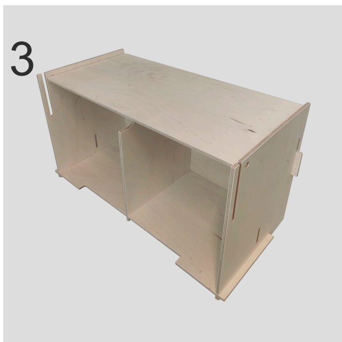
3 Låget (e) kan nu indsættes i de to huller i siderne.