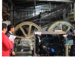
自力下山（搬器運行不能時）対応訓練