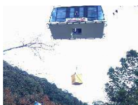
救助訓練（応急下降実地訓練）