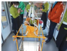
停電時運転(予備エンジン) 訓練