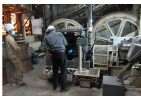
停電時運転 (予備エンジン) 訓練