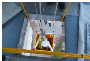
令和 2 年 12 月 5 日実施