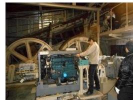
自力下山 (搬器運行不能時) 対応訓練