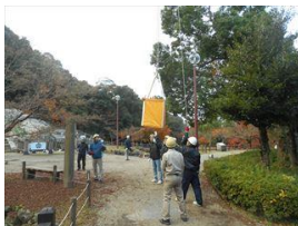
救助訓練 (応急下降実地訓練)