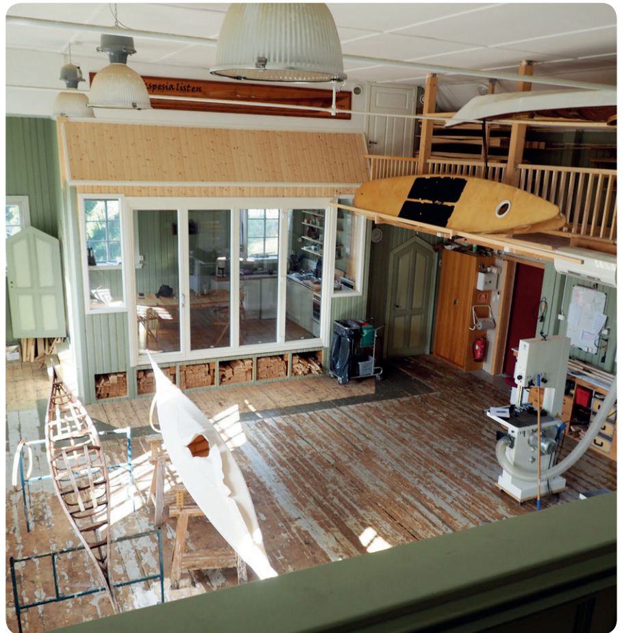
Kirkeskibet er omdannet til byggelokal.