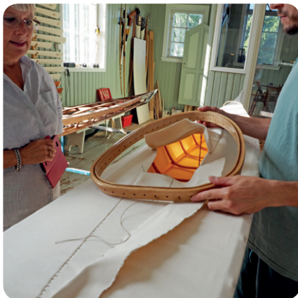
Skelettet betrækkes med bomuldsdug.