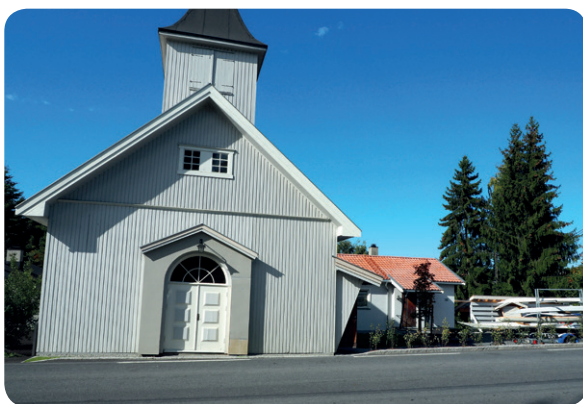
Kirken er sat i stand udvendig med blandt andet ny maling.

Anders bygger traditionelle inuit-kajakker, hvilket giver mulighed for at bygge individuelt, så man får et fleksibelt fartøj. Vægten er totalt 15-19 kilo, hvoraf træskelettet vejer de 12 kilo. Det er vigtigt, at der benyttes lokalt, knastfrit gran på grund af vægten. Træet, som er skåret ud i lister, bøjes over damp. Dampen får Anders fra så enkle kilder som en kedel, en tapetfjerner eller ➤