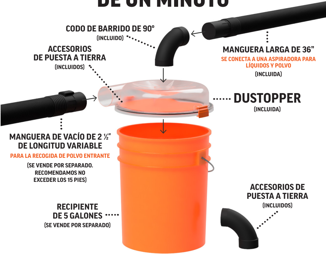
DIAGRAMA DE INSTALACIÓN DE UN MINUTO

En www.dustopper.com , podrá encontrar codos de barrido de 90° y mangueras de 36" adicionales, así como otros accesorios y productos