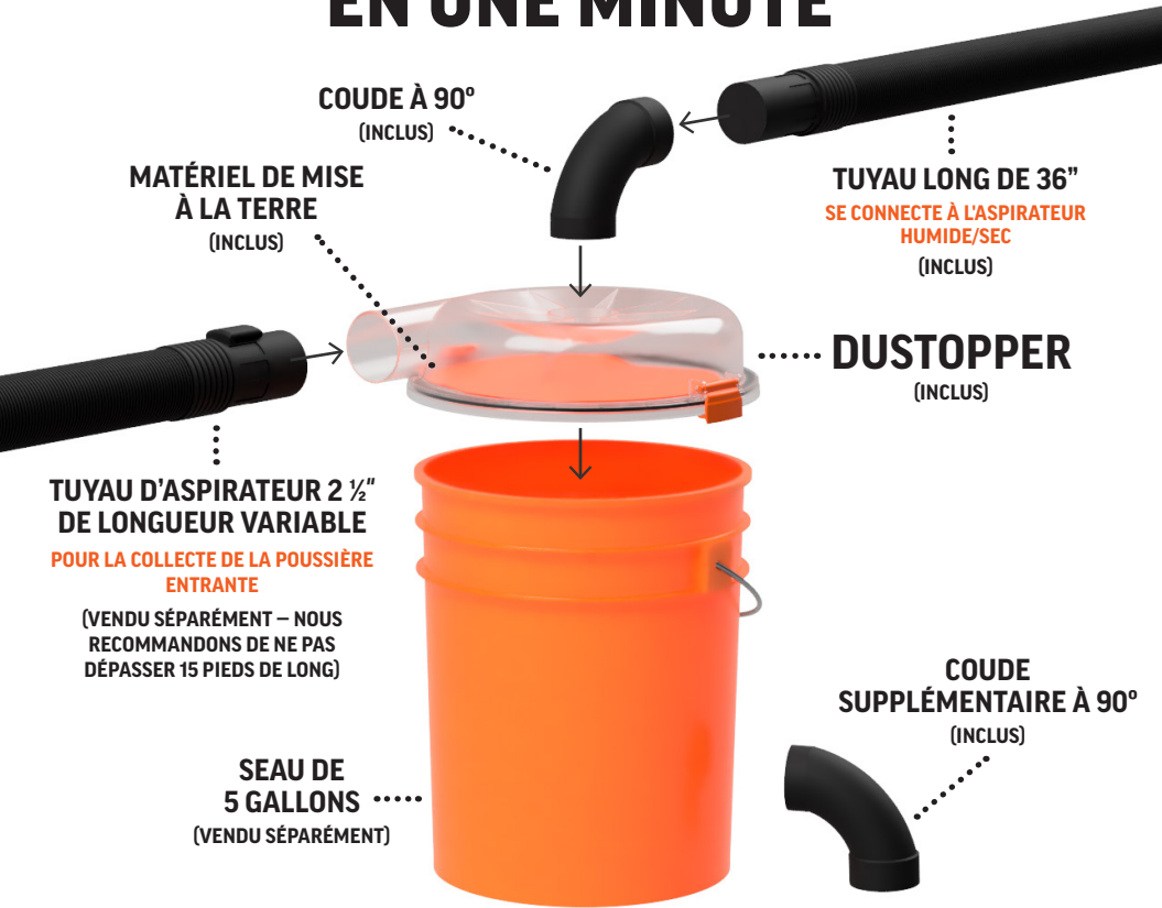
SCHÉMA D'INSTALLATION EN UNE MINUTE

Coudes supplémentaires de 90° pour le balayage, Tuyaux 36 pouces, autres accessoires et marchandises disponibles sur www.dustopper.com .