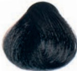
DARKEST BROWN MORENO BRUN