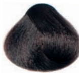
GOLDEN BROWN CASTAÑO DORADO CHÂTAIN DORÉ