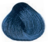
BLUE AZUL BLEU