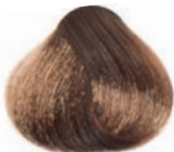
BLOND RUBIO BLOND