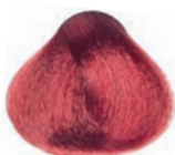
RED BLOND RUBIO ROJIZO BLOND ROUGE