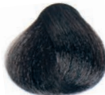
DARK BROWN CASTAÑO OSCURO CHÂTAÎN FONCÉ