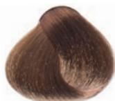
COLD CHOCOLATE LIGHT BLOND RUBIO CLARO CHOCOLATE FRIJO BLOND CLAIR CHOCOLAT FROID