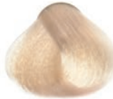
PLATINUM LIGHTEST BLOND RUBIO CLARÍSIMO PLATINADO BLOND TRÈS CLAIR PLATINE