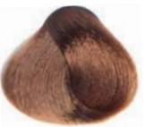
GOLDEN BLOND RUBIO DORADO BLOND DORÉ