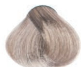
ASH VERY LIGHT BLOND RUBIO CLARÍSIMO CENIZA BLOND TRÈS CLAIR CENDRÉ