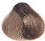
BEIGE LIGHT BLOND RUBIO CLARO BEIGE BLOND CLAIR BEIGE