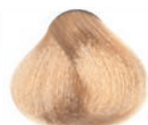
WARM NATURAL VERY LIGHT BLOND RUBIO CLARÍSIMO NATURAL CÁLIDO BLOND TRÈS CLAIR NATUREL CHAUD