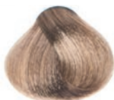
BEIGE VERY LIGHT BLOND RUBIO CLARÍSIMO BEIGE BLOND TRÈS CLAIR BEIGE