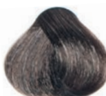
ASH DARK BLOND RUBIO OSCURO CENIZA BLOND FONCÉ CENDRÉ