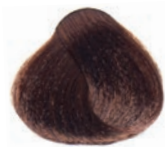
GOLDEN COPPER MOKA DARK BLOND RUBIO OSCURO MOKA COBRE DORADO BLOND FONCÉ MOKA DORÉ CUIVRE