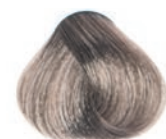
ASH LIGHT BLOND RUBIO CLARO CENIZA BLOND CLAIR CENDRÉ