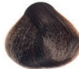
INTENSE BLOND RUBIO INTENSO BLOND INTENSE