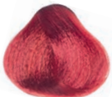
INTENSE RED DARK BLOND RUBIO OSCURO ROJIZO INTENSO BLOND FONCÉ ROUGE INTENSE