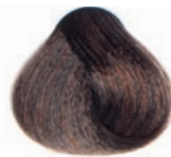
GOLDEN LIGHT BROWN CASTAÑO CLARO DORADO CHÂTAIN CLAIR DORÉ