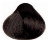
MOKA ASH MEDIUM BROWN CASTAÑO MEDIO CENIZA MOCA CHÂTAÏN MOYEN MOKA CENDRE