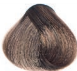
BEIGE BLOND RUBIO BEIGE BLOND BEIGE