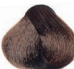
WARM NATURAL DARK BLOND RUBIO OSCURO NATURAL CÁLIDO BLOND FONCÉ NATUREL CHAUD