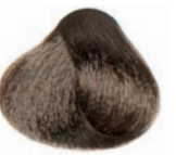
INTENSE BEIGE LIGHT BLOND RUBIO CLARO BEIGE INTENSO BLOND CLAIR BEIGE INTENSE