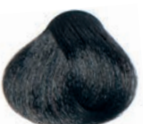
ASH BROWN CASTAÑO CENIZA CHÂTAÎN CENDRÉ