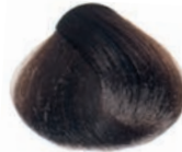
LIGHT BROWN CASTAÑO CLARO CHÂTAÎN CLAIR