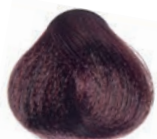
MAHOGANY DARK BLOND RUBIO OSCURO CAOBA BLOND FONCÉ ACAJOU