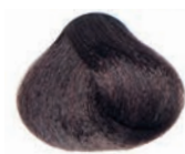
WARM CHOCOLATE LIGHT BROWN CASTAÑO CLARO CHOCOLATE CALIDO CHÂTAÏN CLAIR CHOCOLAT CHAUD