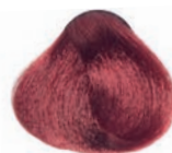
RED DARK BLOND RUBIO OSCURO ROJIZO BLOND FONCÉ ROUGE