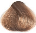
LIGHT BLOND RUBIO CLARO BLOND CLAIR