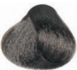
INTENSE ASH LIGHT BLOND RUBIO CLARO CENIZA INTENSO BLOND CLAIR CENDRÉ INTENSE