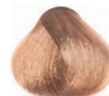
WARM NATURAL LIGHT BLOND RUBIO CLARO NATURAL CÁLIDO BLOND CLAIR NATUREL CHAUD