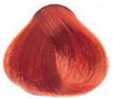
INTENSE COPPER BLOND RUBIO COBRIZO INTENSO BLOND CUIVRE INTENSE