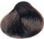
INTENSE DARK BLOND RUBIO OSCURO INTENSO BLOND FONCÉ INTENSE