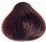
COPPER DARK BLOND RUBIO OSCURO COBRIZO BLOND FONCÉ CUIVRE