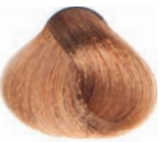
GOLDEN LIGHT BLOND RUBIO CLARO DORADO BLOND CLAIR DORÉ