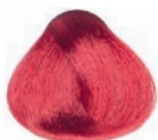
INTENSE RED BLOND RUBIO ROJIZO INTENSO BLOND ROUGE INTENSE