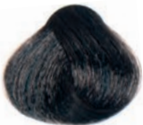
INTENSE BROWN CASTAÑO INTENSO CHÂTAÎN INTENSE