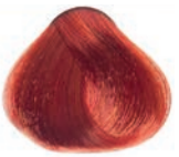
SUPER INTENSE COPPER BLOND RUBIO COBRIZO SUPER INTENSO BLOND CUIVRE EXTRA INTENSE