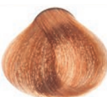
GOLDEN COPPER VERY LIGHT BLOND RUBIO CLARÍSIMO DORADO COBRIZO BLOND TRÈS CLAIR DORÉ CUIVRE