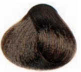
INTENSE BEIGE MEDIUM BLOND RUBIO MEDIO BEIGE INTENSO BLOND MOYEN BEIGE INTENSE