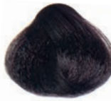
COPPER BROWN CASTAÑO COBRIZO CHÂTAIN CUIVRE