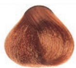
GOLDEN COPPER LIGHT BLOND RUBIO CLARO DORADO COBRIZO BLOND CLAIR DORÉ CUIVRE