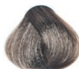
ASH BLOND RUBIO CENIZA BLOND CENDRÉ