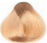
GOLDEN VERY LIGHT BLOND RUBIO CLARÍSIMO DORADO BLOND TRÈS CLAIR DORÉ