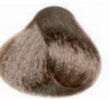
INTENSE BEIGE VERY LIGHT BLOND RUBIO EXTRA CLARO BEIGE INTENSO BLOND TRÈS CLAIR BEIGE INTENSE