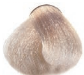
NATURAL ASH ULTRA BLOND SUPER-ACLARANTE NATURAL CENIZA ULTRA BLOND NATUREL CENDRE