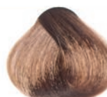
WARM NATURAL BLOND RUBIO NATURAL CÁLIDO BLOND NATUREL CHAUD