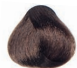
WARM CHOCOLATE DARK BLOND RUBIO OSCURO CHOCOLATE CALIDA BLOND FONCÉ CHOCOLAT CHAUD