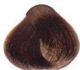
COLD CHOCOLATE BLOND RUBIO CHOCOLATE FRIJO BLOND CHOCOLAT FROID