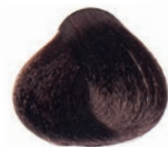
GOLDEN COPPER MOKA LIGHT BROWN CASTAÑO CLARO MOKA COBRE DORADO CHÂTAIN CLAIR MOKA DORÉ CUIVRE