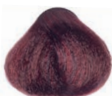
MAHOGANY BLOND RUBIO CAOBA BLOND ACAJOU