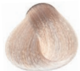
BEIGE SUPER ULTRA BLOND SUPER ULTRA RUBIO BEIGE SUPER ULTRA BLOND BEIGE