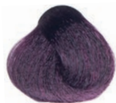
VIOLET VIOLETA VIOLET