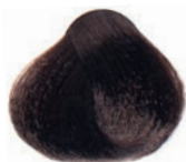
COLD CHOCOLATE LIGHT BROWN CASTAÑO CLARO CHOCOLATE FRIJO CHÂTAIN CLAIR CHOCOLAT FROID