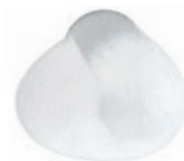
CLEAR NEUTRO NEUTRE