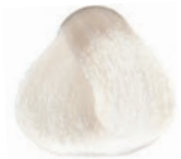
SUPER ULTRA PLATINUM BLOND SUPER-ACLARANTE RUBIO PLATINO SUPER ULTRA BLOND PLATINE