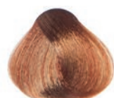
WARM CHOCOLATE LIGHT BLOND RUBIO CLARO CHOCOLATE CALIDA BLOND CLAIR CHOCOLAT CHAUD