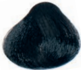
BLACK NEGRO NOIR