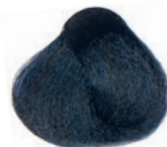
BLUE BLACK NEGRO AZULADO NOIR BLEU