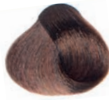
GOLDEN DARK BLOND RUBIO OSCURO DORADO BLOND FONCÉ DORÉ