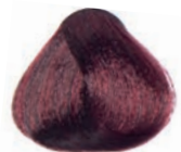
RED LIGHT BROWN CASTAÑO CLARO ROJIZO CHÂTAÏN CLAIR ROUGE