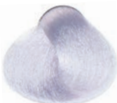
SUPER ULTRA ASH VIOLET BLOND SUPER-ACLARANTE CENIZA IRISADO SUPER ULTRA BLOND CENDRE IRISÉ