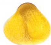
YELLOW AMARILLO JAUNE