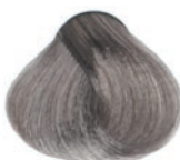
ASH VIOLET LIGHT BLOND RUBIO CLARO CENIZA VIOLETA BLOND CLAIR CENDRÉ VIOLET