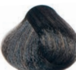
ASH LIGHT BROWN CASTAÑO CLARO CENIZA CHÂTAÎN CLAIR CENDRÉ