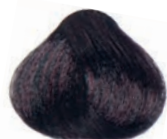
MAHOGANY BROWN CASTAÑO CAOBA CHÂTAÏN ACAJOU