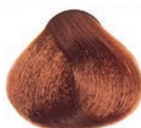
GOLDEN COPPER BLOND RUBIO DORADO COBRIZO BLOND DORÉ CUIVRE