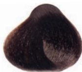
COLD CHOCOLATE DARK BLOND RUBIO OSCURO CHOCOLATE FRIJO BLOND FONCÉ CHOCOLAT FROID