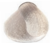
NATURAL VIOLET SUPER ULTRA BLOND SUPER-ACLARANTE NATURAL IRISADO SUPER ULTRA BLOND NATUREL IRISÉ