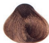
WARM CHOCOLATE BLOND RUBIO CLARO CHOCOLATE CALIDA BLOND CHOCOLAT CHAUD