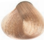
VERY LIGHT BLOND RUBIO CLARÍSIMO BLOND TRÈS CLAIR