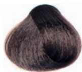
BEIGE LIGHT BROWN CASTAÑO CLARO BEIGE CHÂTAIN CLAIR BEIGE