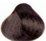
MOKA ASH DARK BLOND RUBIO OSCURO CENIZA MOCA BLOND FONCÉ MOKA CENDRE