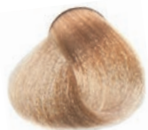
NATURAL ULTRA BLOND ULTRA RUBIO NATURAL ULTRA BLOND NATUREL