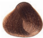
GOLDEN COPPER MOKA MEDIUM BLOND RUBIO MEDIO MOKA COBRE DORADO BLOND MOYEN MOKA DORÉ CUIVRE