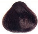
COPPER LIGHT BROWN CASTAÑO CLARO COBRIZO CHÂTAIN CLAIR CUIVRE