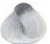
SILVER PLATA ARGENT