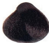
GOLDEN COPPER MOKA MEDIUM BROWN CASTAÑO MEDIO MOKA COBRE DORADO CHÂTAIN MOYEN MOKA DORÉ CUIVRE