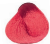
RED ROJO ROUGE