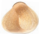
NATURAL GOLDEN ULTRA BLOND SUPER-ACLARANTE NATURAL DORADO ULTRA BLOND NATUREL DORÉ