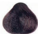
INTENSE MAHOGANY LIGHT BROWN CASTAÑO CLARO CAOBA INTENSO CHÂTAÏN CLAIR ACAJOU INTENSE