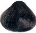
INTENSE LIGHT BROWN CASTAÑO CLARO INTENSO CHÂTAÎN CLAIR INTENSE