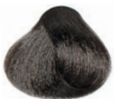
INTENSE ASH MEDIUM BLOND RUBIO MEDIO CENIZA INTENSO BLOND MOYEN CENDRÉ INTENSE