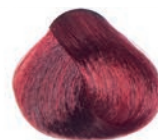
INTENSE RED LIGHT BROWN CASTAÑO CLARO ROJIZO INTENSO CHÂTAÏN CLAIR ROUGE INTENSE