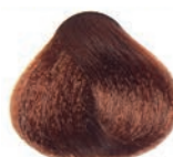
GOLDEN COPPER DARK BLOND RUBIO OSCURO DORADO COBRIZO BLOND FONCÉ DORÉ CUIVRE