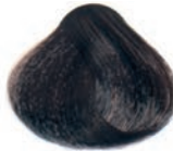
BROWN CASTAÑO CHÂTAÎN