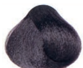
VIOLET BROWN CASTAÑO VIOLETA CHÂTAÏN VIOLET