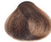
INTENSE LIGHT BLOND RUBIO CLARO INTENSO BLOND CLAIR INTENSE