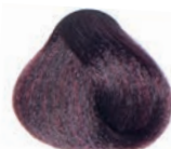
VIOLET LIGHT BROWN CASTAÑO CLARO VIOLETA CHÂTAÏN CLAIR VIOLET