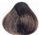
BEIGE DARK BLOND RUBIO OSCURO BEIGE BLOND FONCÉ BEIGE