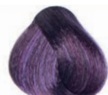
INTENSE VIOLET LIGHT BROWN CASTAÑO CLARO VIOLETA INTENSO CHÂTAÏN CLAIR VIOLET INTENSE