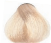
WARM NATURAL PLATINUM LIGHTEST BLOND RUBIO CLARÍSIMO PLATINO NATURAL CÁLIDO BLOND TRÈS CLAIR PLATINE NATUREL CHAUD