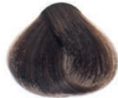
DARK BLOND RUBIO OSCURO BLOND FONCÉ