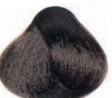
WARM NATURAL LIGHT BROWN CASTAÑO CLARO NATURAL CÁLIDO CHÂTAÎN CLAIR NATUREL CHAUD