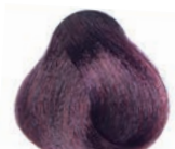
VIOLET DARK BLOND RUBIO OSCURO VIOLETA BLOND FONCÉ VIOLET