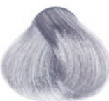
ASH VIOLET PLATINUM LIGHTEST BLOND ULTRABIONDO PLATINO CENERE VIOLETA RUBIO PLATINO CENIZA VIOLETA BLOND PLATINE CENDRÉ VIOLET