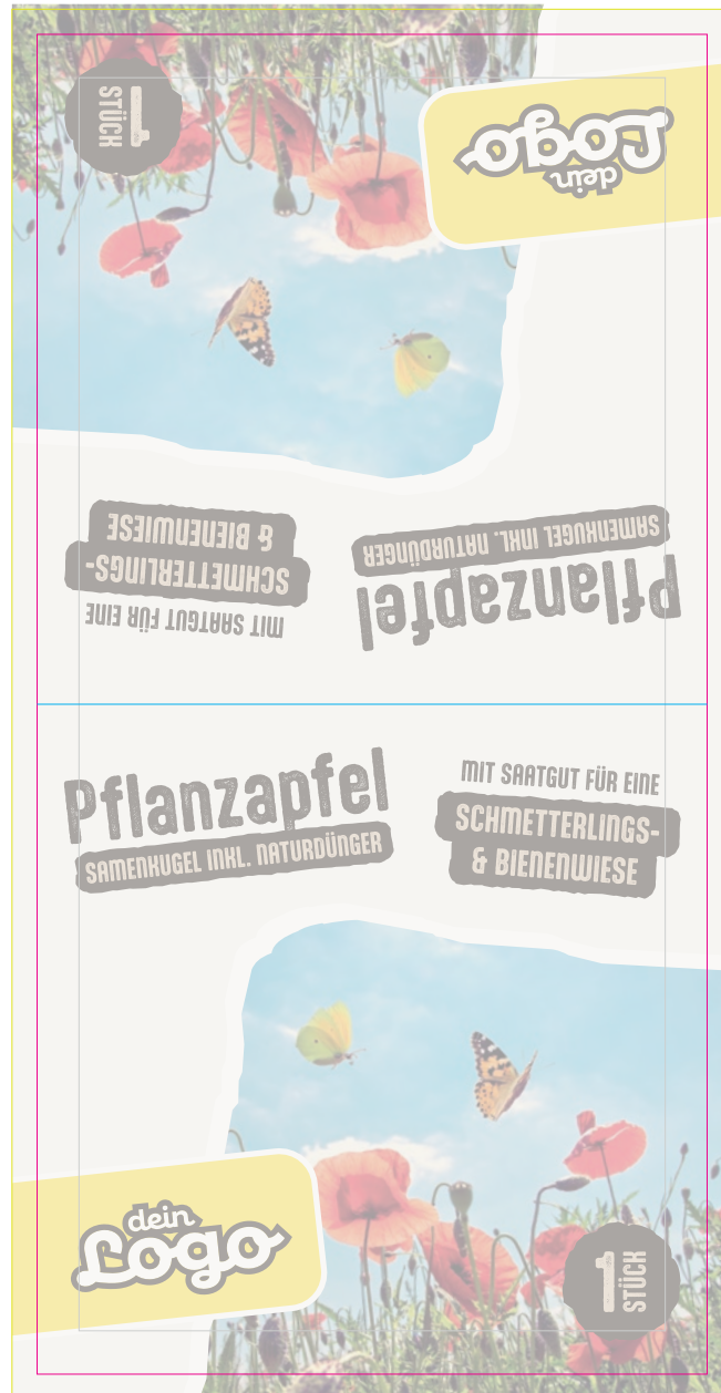
Faltkarte Außenseite 80x160mm