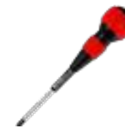
プラスドライバー

本製品の仕様およびデザインは、予告なしに変更することがあります。 また、掲載された仕様やイメージ (写真) は実際と異なる場合があります。