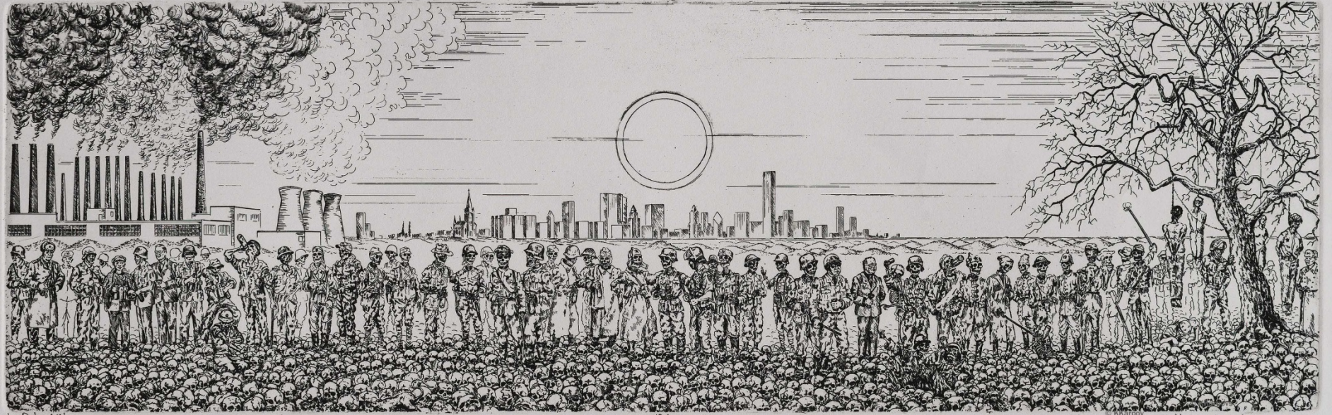
La Dolce Vita