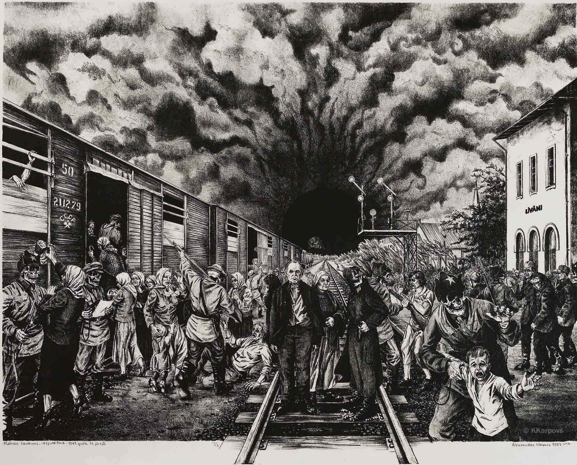
Mākslās darbs - 1991. gada 21. jūlijs.