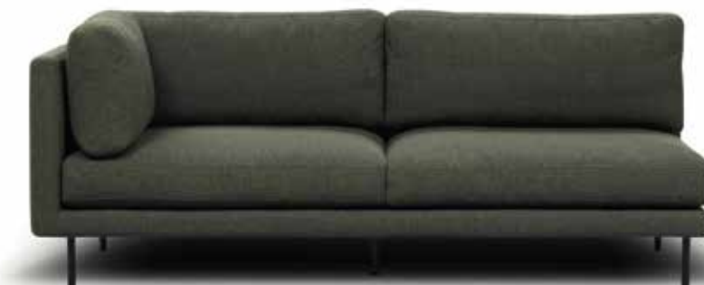
Kuvassa Viva C 209 ilman tereitä | Viva C 209 without piping