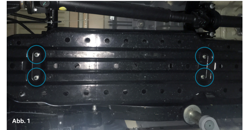
Original Schrauben / original screws