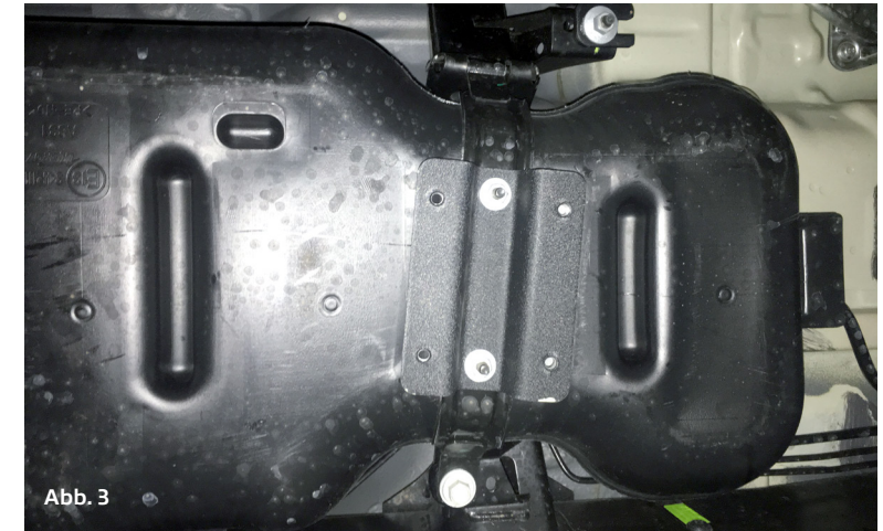
montierte Halterungen vorne / mounted brackets front