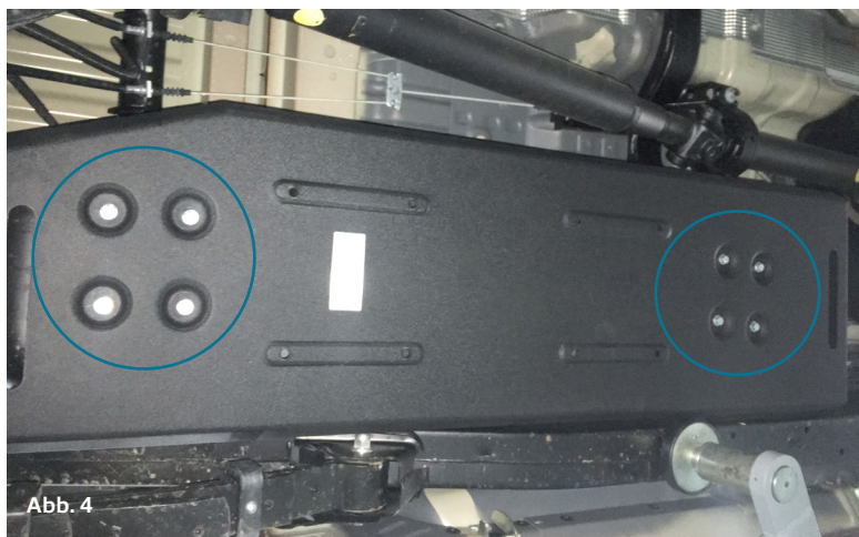
Abb. 4 montierter Unterfahrerschutz / mounted skid plate