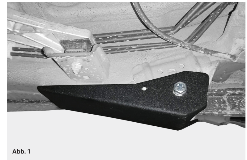
Abb. 1 Längslenkerschutz montiert / skid plate in place

The installation of this skid plates must be executed by a trained professional mechanic. To install the plates the trailing arms must be loosened, if this is done in adequate stored energy from the springs can unload suddenly or the car may fall to the ground!